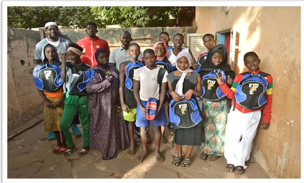
Les enfants plus âgés de l'ACFA prêts pour l'école avec leurs nouveaux sacs à dos