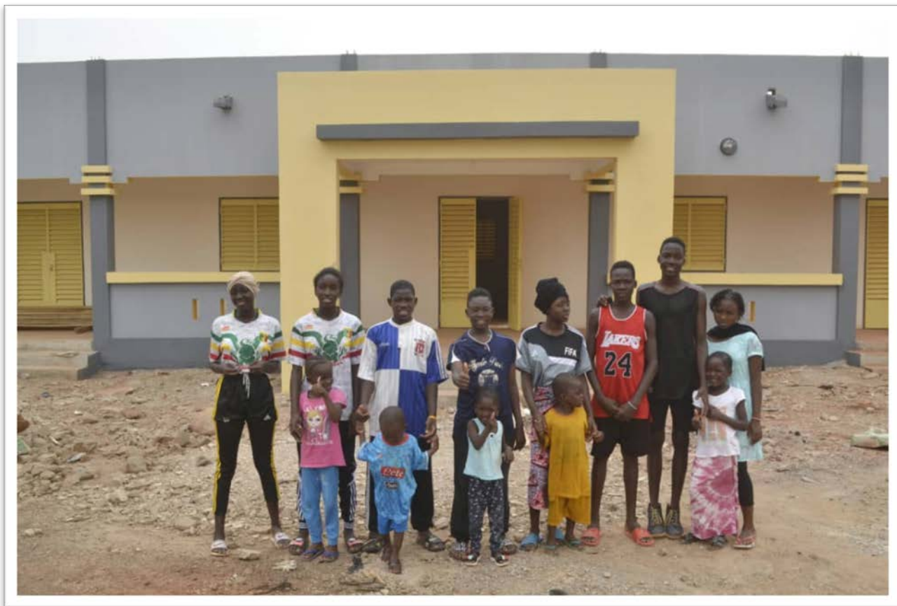
Les enfants de ACFA devant la nouvelle école de Zorokoro