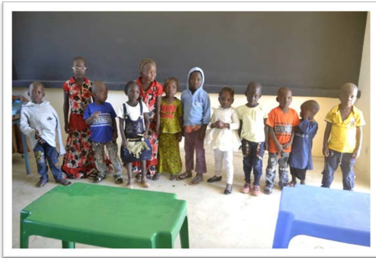
Les nouveaux étudiants de l'ACFA à l'école de Zorokoro

Le tableau ci-dessous présente les actifs financiers de l'ACFA aux 31 décembre 2020 et 2019. L'objectif de l'ACFA est généralement de maintenir les actifs financiers pour couvrir 90 jours de dépenses d'exploitation (environ 24 000 $). À la fin de 2020, ACFA disposait de liquidités suffisantes pour couvrir seulement 67 jours d'opérations. Dans le cadre de son plan de liquidité, les excédents de trésorerie d'ACFA sont généralement investis dans des placements à court terme, y compris les comptes du marché monétaire. L'ACFA n'a pas de carte de crédit et aucune marge de crédit disponible dans aucune banque