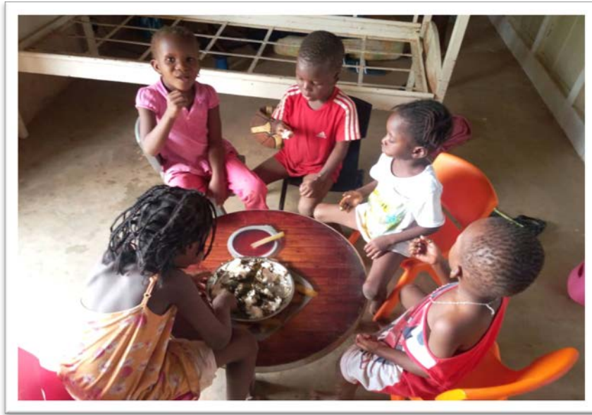
Des enfants de l'ACFA en train de déjeuner à Zorokoro

Nutrition : Au quotidien, le personnel de l'ACFA prépare et sert aux enfants un menu sain et équilibré approuvé par un nutritionniste. Des collations sont également proposées deux fois par jour (le matin et l'après-midi). Ce régime équilibré est en outre complété par l'apport de vitamines. Un tel régime est essentiel pour le développement physique et mental des enfants. De plus, tous nos enfants ont des régimes spéciaux recommandés sur la base de leurs activités sportives. Enfin, l'ACFA fournit des repas et des collations à tous les élèves qui fréquentent son école de Zorokoro. En effet, nous savons que les enfants des villages qui fréquentent notre école ne reçoivent pas trois repas par jour à la maison, et que sans une alimentation adéquate on ne peut pas s'attendre à ce qu'ils aient des bons résultats scolaires et sportifs.